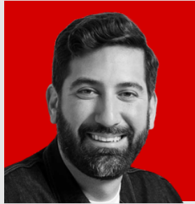
JUAN CARLOS HANK