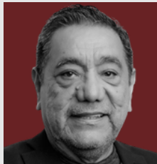
FÉLIX SALGADO MACEDONIO